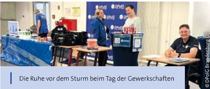
Die Ruhe vor dem Sturm beim Tag der Gewerkschaften