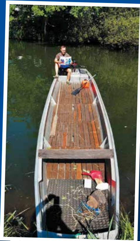
> Dank POLIZEISPIEGEL alles im Lot auf dem Boot – Platz zwei