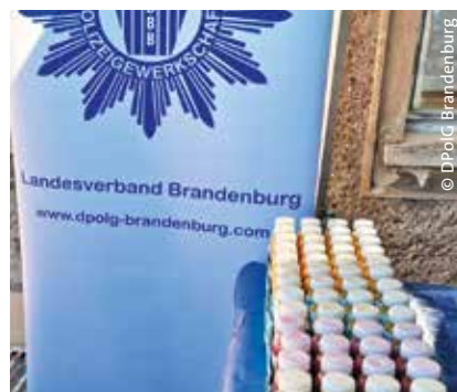
> Die DPoIG-Saftbar

„Durch Sport gesund bleiben, um so den Anforderungen im beruflichen Alltag gewachsen zu sein.“ Ein Thema für jeden Kollegen und damit auch für uns als Polizeigewerkschaft. Am 1. September fand getreu diesem Motto der Gesundheitstag des Polizeipräsidioms auf dem Campus Potsdam-Eiche statt. Spaß an der Bewegung stand im Vordergrund. Die Teilnehmer konnten sich an Altbewährtem wie Fahrradfahren und Nordic Walking, aber auch an neueren Disziplinen wie Jumping und Cross Fitness versuchen. Auch Freunde des Ballportes kamen bei Tischtennis und Beachvolleyball auf ihre Kosten.