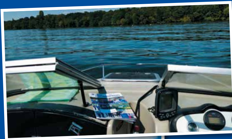
> Land in Sicht – das Siegerfoto