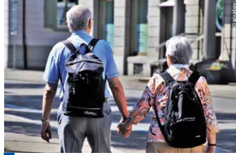
Die Lebensbedingungen unserer Senioren wurden in einer Studie untersucht.

Es wurden im Anschluss die Aktivitäten im Jahr 2021 ausgewertet und auch die Zusammenarbeit mit der Seniorengruppe des ddb berlin erwähnt. In diesem Jahr wird es im Herbst ein Seminar „Alter – Vorsorge – Erbfall“ und „Vorbereitung auf den Ruhestand“ geben.