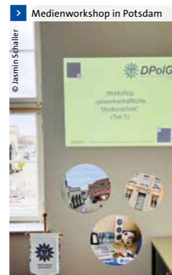
> Medienworkshop in Potsdam

Vielen Dank an dieser Stelle an unseren Berliner Kollegen für die unkomplizierte Zusammenarbeit!