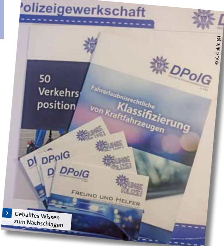
> Geballtes Wissen zum Nachschlagen