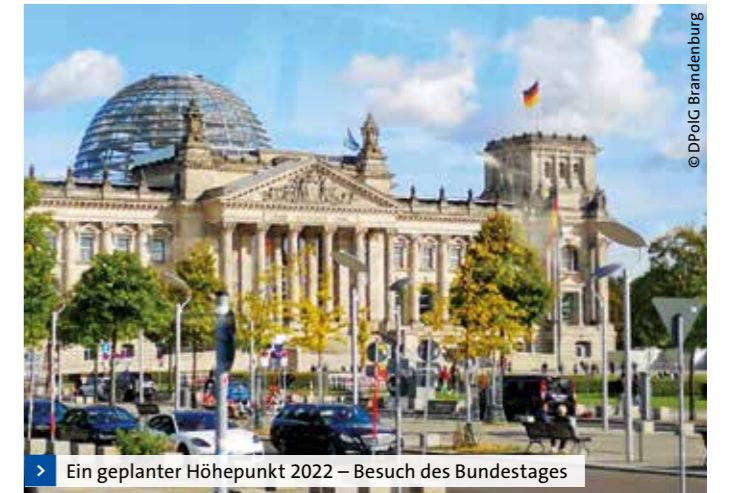
> Ein geplanter Höhepunkt 2022 – Besuch des Bundestages

Bereits einmal haben wir für unsere Ruheständler eine Bundestagsbesichtigung organisiert. Leider fiel sie im März 2020 den Coroneinschränkungen zum Opfer. Diesen attraktiven Ausflug in die Hauptstadt wollen wir im Herbst nachholen. Wir schauen dann den Parlamentariern