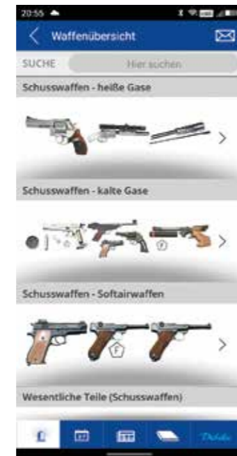
> Waffenrecht kompakt