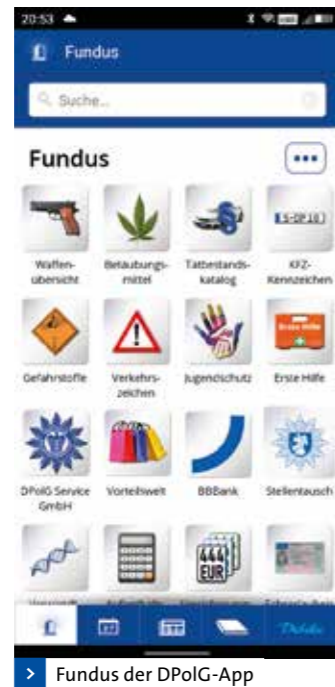
> Fundus der DPoIG-App

Wer lieber Papier in der Hand hält, für den ist der „Freund und Helfer“ genau das Richtige. Die wichtigsten Informationen finden sich gedruckt im handlichen Format zum Nachschlagen. Den „Freund und Helfer“ sowie weitere nützliche Informationen für euren Dienstalltag erhält ihr direkt bei euren DPoIG-Ansprechpartnern vor Ort.