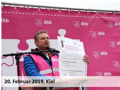
20. Februar 2019, Kiel