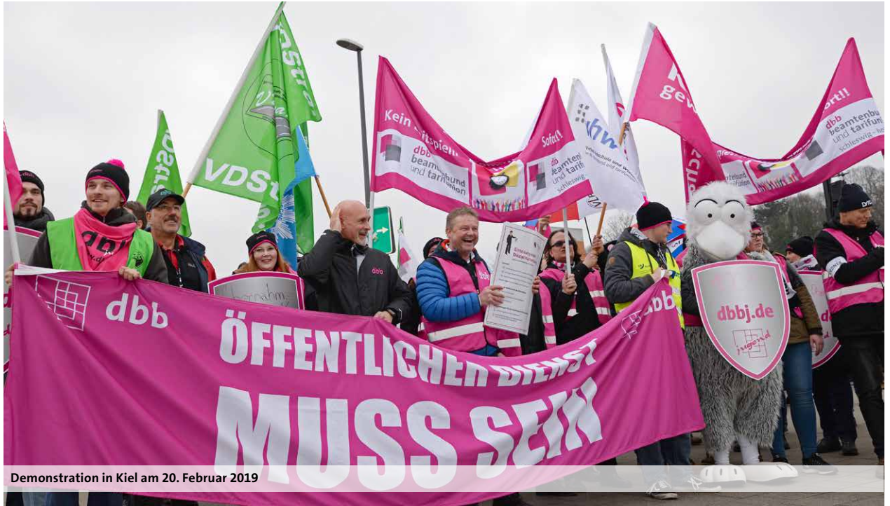
Demonstration in Kiel am 20. Februar 2019

Am 28. Februar 2019 gehen die Tarifverhandlungen für die Beschäftigten im öffentlichen Dienst der Länder mit der Tarifgemeinschaft deutscher Länder (TdL) in die entscheidende Runde. Um der Arbeitgeberseite deutlich zu machen, was sie von der bisherigen Verweigerungshaltung in den Verhandlungen halten, haben Landesbeschäftigte in den vergangenen Tagen bundesweit die Arbeit niedergelegt und sich zu Protestaktionen versammelt.