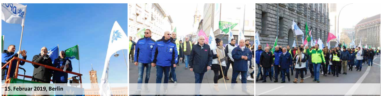
15. Februar 2019, Berlin