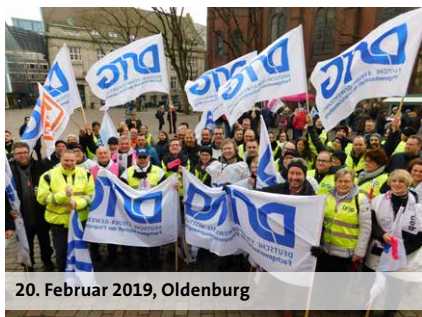
20. Februar 2019, Oldenburg