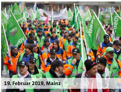
19. Februar 2019, Mainz