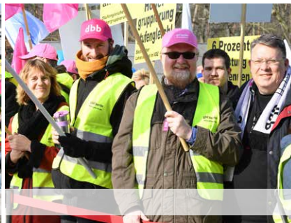
1. März 2019, Potsdam